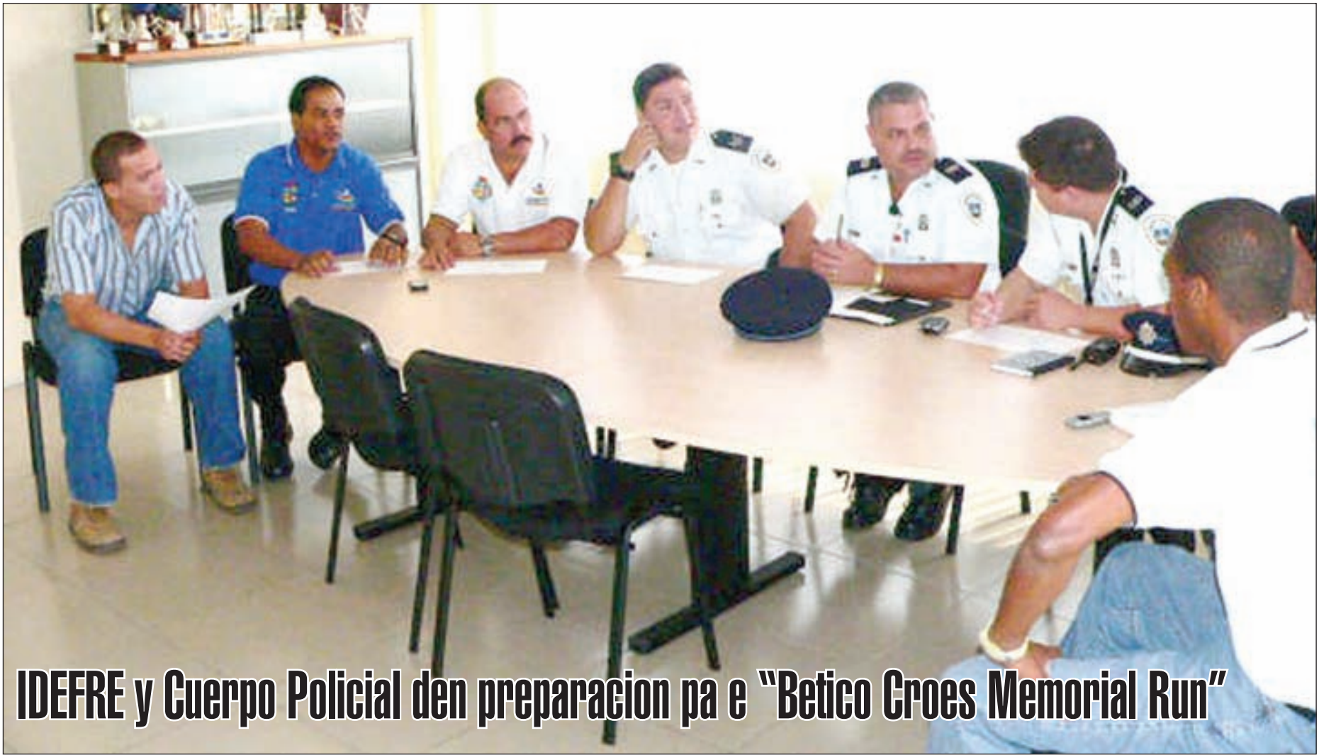
IDEFRE y Cuerpo Policial den preparacion pa e "Betico Croes Memorial Run"